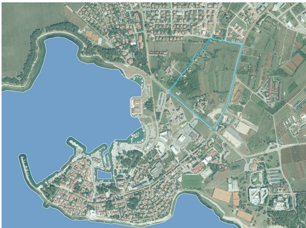
slika 1- šire područje obuhvata UPU Šaini jug I

Ugovorom između Grada Novigrada (nositelj izrade: Upravni odjel za komunalni sustav, prostorno uređenje i zaštitu okoliša) i Urbisa d.o.o. Pula kao stručnog izrađivača određene su međusobne obveze u postupku izrade i donošenja Plana. Na temelju navedene ugovorne obveze pristupilo se izradi Plana, kao prostorno planskoj osnovi za uređenje obuhvaćenog područja.